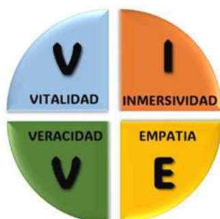
Fig. b4. Elementos del Principio VIVE

En el "Método VITbER", esta fase valida la entrega como secuencia relacional, cultural y emocional. Es poner a prueba los prototipos con usuarios reales, recogiendo retroalimentación para refinar la solución.