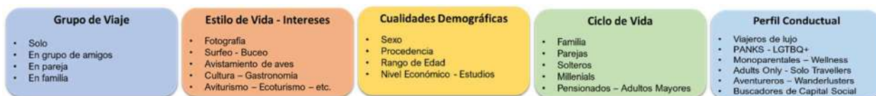
Fig. b2. Perfil & Caracterización del Viajero