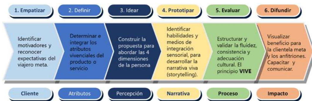
Fig. b1. Proceso de Diseño Vivencias Turísticas - Método VITbER