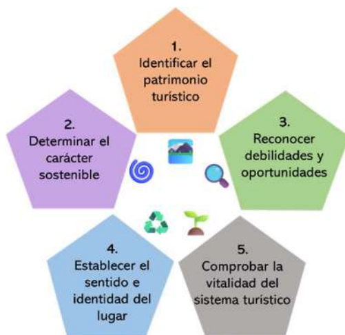
Fig. a1 – Desarrollo de la Evaluación RETbER

La implementación de RETbER como instrumento de análisis sistémico en procesos de planificación turística con enfoque regenerativo se estructura en cinco pasos interrelacionados, que permiten leer el territorio desde su vocación profunda y su potencial transformador. (Fig. a1).