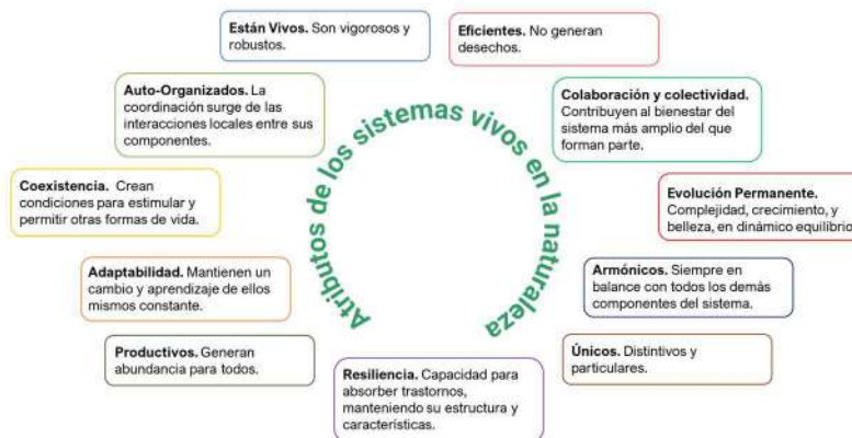
Fig. a4 – Atributos del Turismo Como Sistema Vivo en la Naturaleza